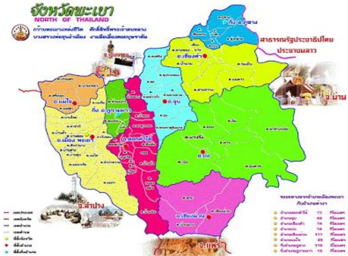
ภาพที่ 1 แผนที่แสดงอาณาเขตของจังหวัดพะเยา